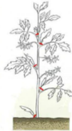
Fig. 5: supprimer les gourmands.

Que serait un été de jardinier sans la tomate ? Elle appartient à la famille des Solanacées au même titre que les poivrons et les aubergines, tous originaires d'Amérique du sud.